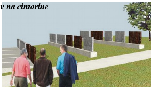
Obr. vľavo – jednohroby nad sebou, dvojhroby, urnová stena Obr. vpravo – jednohroby nad sebou, len s náhrobným kameň