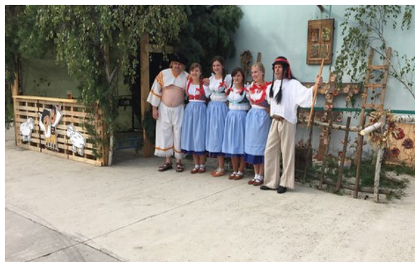
Kubko s Matkom a dievčatami pri kolibe