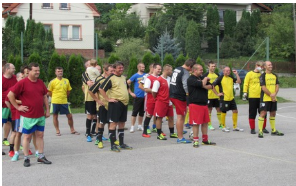
Mužstvá Bojníc, Old boys, Juveko a Lukoveček