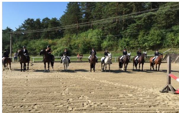
Nastúpení jazdci na koníkoch