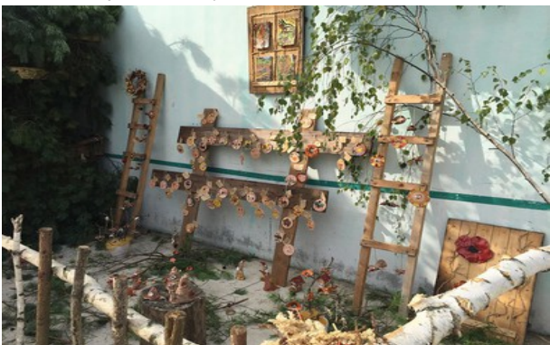
Výstavka keramiky zhotovenej deťmi z obce