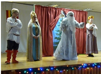
Divadelné predstavenie Mrázik