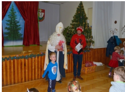
Mikuláš pri rozdávaní darčiekov