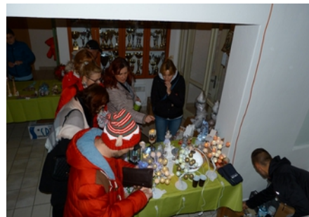
Vianočné trhy – stánok s ozdobami